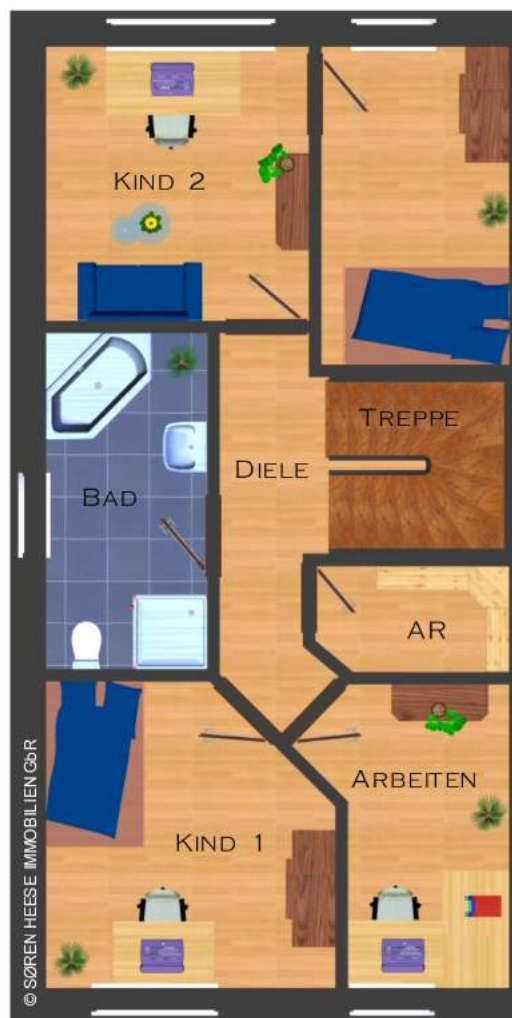
- DAS OBERGESCHOSS -

MÖBLIERUNGSVORSCHLAG: REALVERHÄLTNISSE KÖNNEN ABWEICHEN