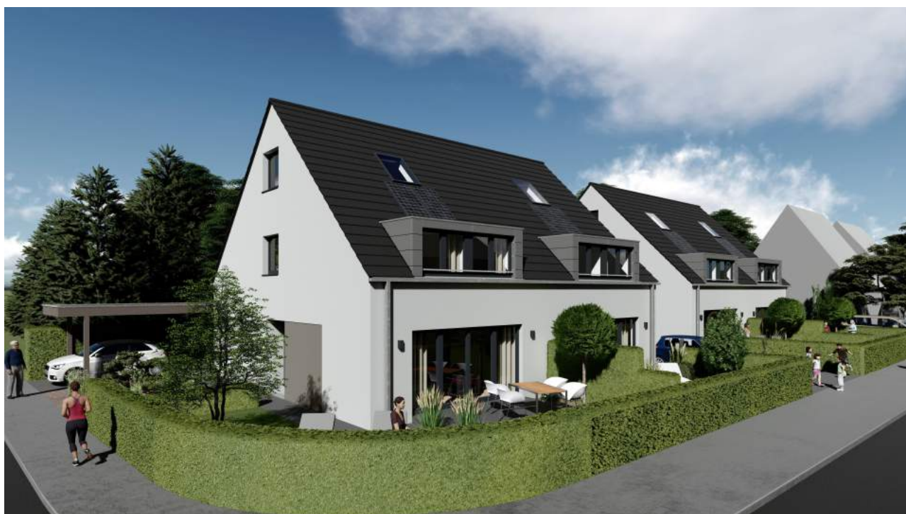
Computeranimation: Darstellung beispielhaft, unverbindlich und kann von der Realität abweichen